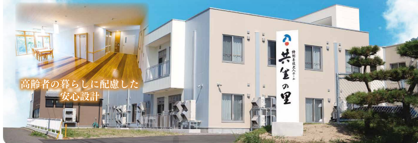
高齢者の暮らしに配慮した 安心設計

地域とのふれあいを大切に ここに暮らすみんなが楽しく幸せに 生活できる家(施設)を目指します