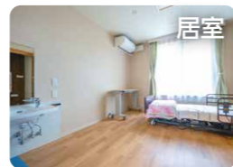
居室 明るく過ごしやすい1人部屋です。