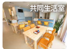
共同生活室 大きな窓があります。いつも人が集まります。