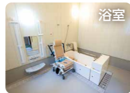
浴室 ゆったり広々、安心してご入浴いただけます。