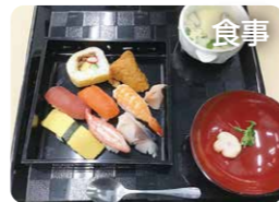
食事 飽きないメニューで行事食も楽しめます。